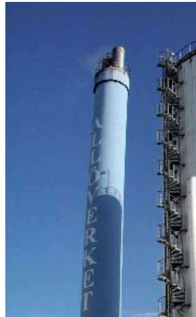
Skorsten og akkumuleringstank på det træfyrede Allöværk i Kristianstad. Bemærk den meget svage røgfane, hvilket skyldes, at en meget stor del af vanddampen fra røggassen uddrives ved opfugning af forbrændingsluften.