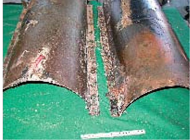
Foto 4: Muffesamling med skadet polyuretanbelægning og begyndende overfladekorrosion.

Beskrivelsen af Long Range Ultralydmålinger og resultaterne af vores målinger følger i en særskilt artikel.