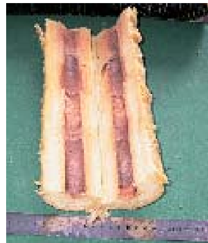
Foto 2: Isolering omkring Aqua-varm rør. Intet tegn på opfugtning af isoleringsmateriale.

Inden undersøgelsen blev sat i gang, blev opbygningen af fjernvarmesystemet vurderet ud fra tegningsmateriale leveret af Varmeforsyningen, suppleret med data over registrering af brud og reparationer udført siden anlæggets etablering i 1981.