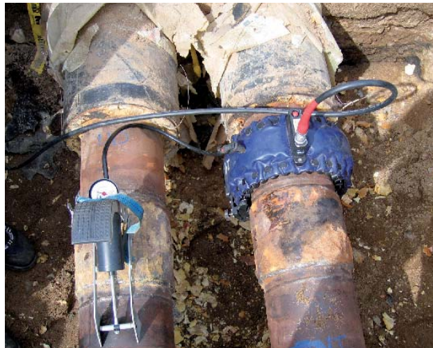
Montering af ultralydbælte på fjernvarmerør.

I Kalundborg Kommune forløb selve processen på den måde, at FORCE Technology eksperter inden for ultralydundersøgelse, visuel inspektion og korrosion udvalgte seks forskellige steder på ledningsnettet, hvor