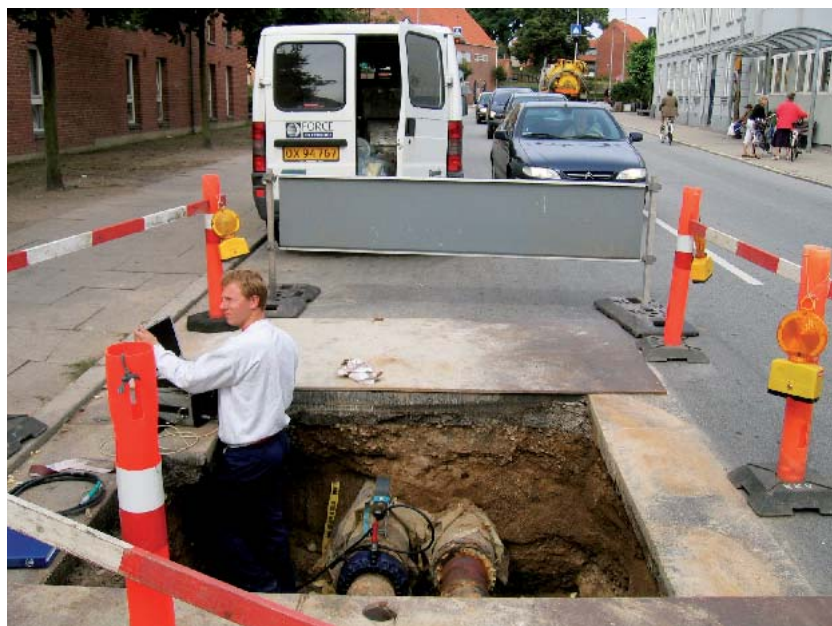
Inspektion af fjernvarmerør i Bredgade i Kalundborg.

Teknikken er udviklet til brug på rørstrækninger, som ikke er tilgængelige pga. nedgravning, isolering, høj placering (herunder anlæg som kræver omfattende stilladsbygning, for "normal" adkomst), vejunderføringer, gennemføringer m.m., og kan bruges på varme overflader og rørsystemer, der er i drift. Metoden er derfor særdeles velegnet i forbindelse med tilstandskontrol og restlevetidsvurdering af fjernvarmeledninger.