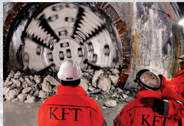
Boremaskinen Astrid rammer plet og bryder igennem ved Adelgade. Dermed er første etape af Københavns nye varmetunnel gennemført.