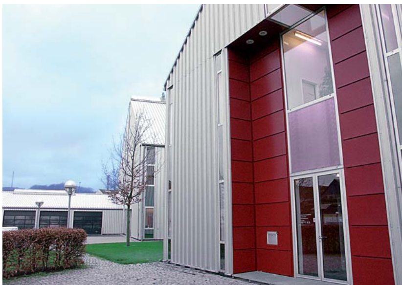
Siden 1990 har Odder Varmeværk holdt til her på Skovdalsvej i det nordlige Odder. Administrationsbygningen blev for nylig udvidet for også at gøre plads til Odder Vandværk