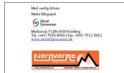
Eksempel på autosignatur.

hvad en række kendte danskere fortæller om fjernvarmen. Der er også en fotokonkurrence, hvor alle kan deltage. Det aktuelle tema er hjertevarme, og mange danskere har allerede indsendt deres billeder. De kan nu ses på kampagnesitet.