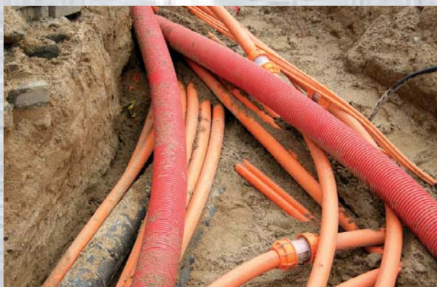
Bredbåndskaos i Fredericia.