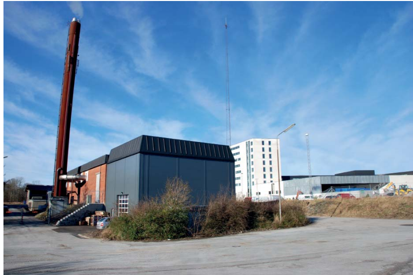
Bygningen, som rummer fjernkølingsanlægget ses i forgrunden, lige ved siden af Hjørring Varmeforsynings eksisterende kedelcentral. Det hvide højhus bagved en del af det storcenter, der skal forsynes med køling. Afstanden er kun 170 meter.

- Aftaget og dermed salget af køling er helt afgørende for økonomien i projektet. Hvis det beregnede forbrug kommer hjem, hænger det hele sammen, som det skal. Men det er jo en danmarkspremiere, så det bliver spændende at se, om det går, som vi