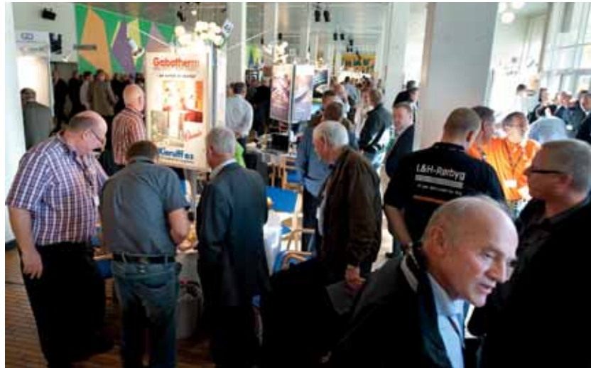
Med 89 træpunkter og fem stande satte træpunktudstillingen også rekord. Gennem begge landsmødets dage var der stor aktivitet.

Dansk Fjernvarmes formand rettede opmærksomheden mod et par af de emner, der vil få stor betydning i