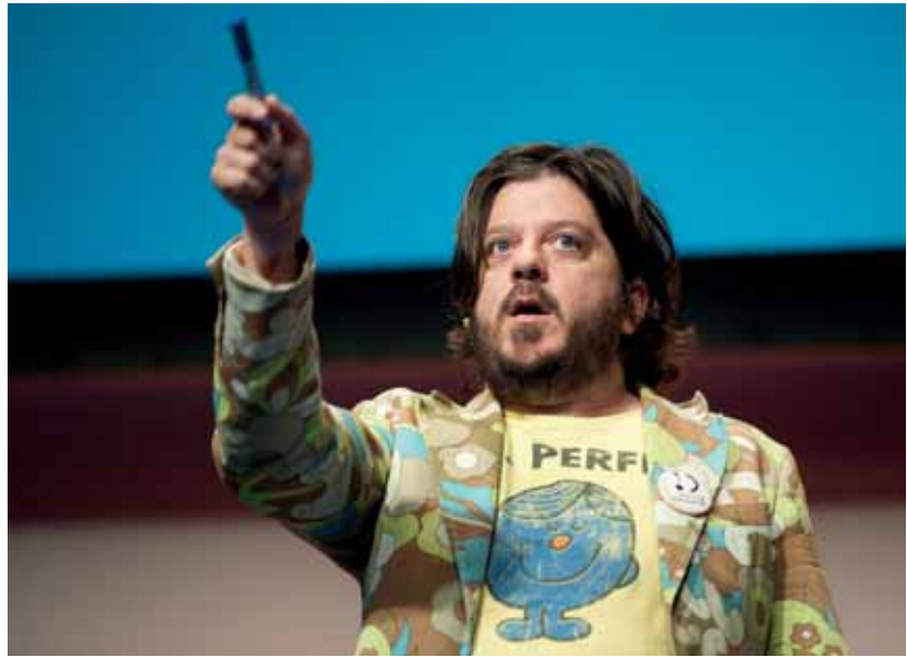
Anders Lund Madsen rundede landsmødet af med et indlæg, der vist nok handlede om at holde indlæg. Og lidt om at mime et varmegærk.

Journalist og studievært, Anders Lund Madsen, stod for landsmødets sidste indslag med et yderst underholdende causeri. Her fik deltagerne indblik i