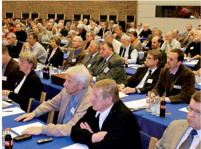
De fremmødte ved Dansk Fjernvarmes generalforsamling kunne uden bemærkninger godkende såvel regnskab for 2004 som budgettet for 2005. Opmærksomheden samlede sig i stedet om formandens beretning.