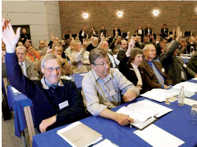
Der var valg på flere poster til bestyrelsen i Dansk Fjernvarme. De valg foregik dog i de forskellige medlemsgrupper. I fællesskab kunne forsamlingen med et smil nøjes med at godkende generalforsamlingens lovlighed samt regnskab og budget.

Fremtidens energipolitik var også på dagsordenen i den såkaldte Energy