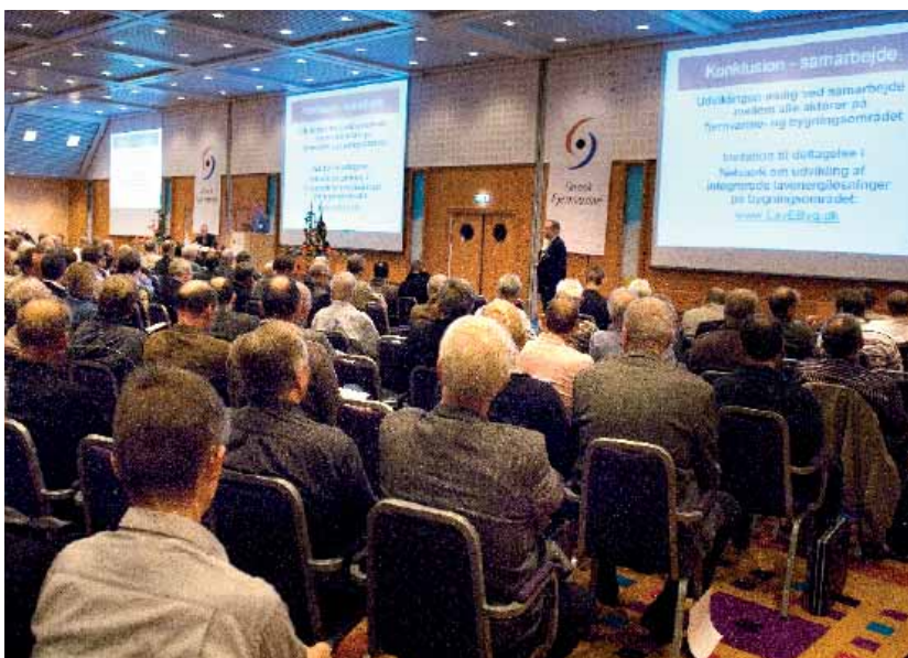
Et meget højt deltagerantal og et stort engagement i debatten fra de fremmødtes side var også i år kendetegnende for Dansk Fjernvarmes landsmøde.

I 70'erne var afhængigheden af olie naturligt nok i fokus, og kulfyring