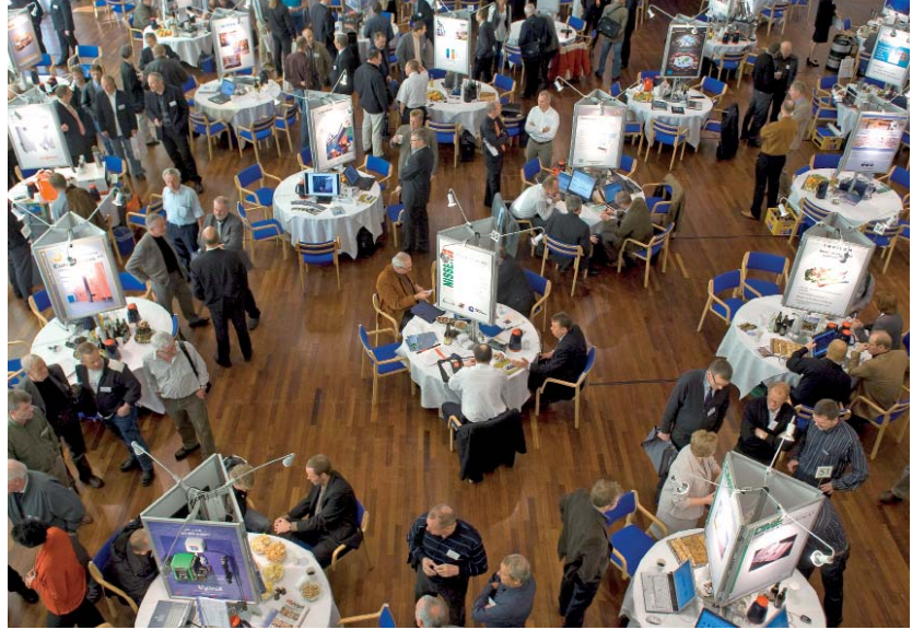
I år var det 20. gang, FIF Marketing arrangerede træfpunkter i forbindelse med Dansk Fjernvarmes landsmøder, og med 82 udstillere blev der endnu engang sat rekord.