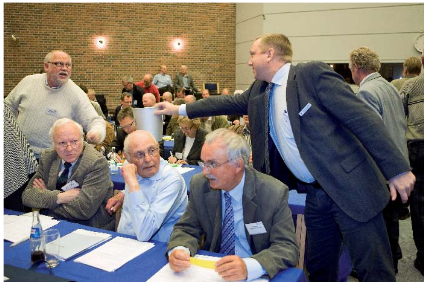
På opfordring fra Solrød Fjernvarme blev der skriftlig afstemning om det ekstraordinære kontingent til branding af fjernvarme. Der var 342 stemmer for og 22 imod.

- Hvordan indsatsen konkret skal tilrettelægges, vil der først blive taget nærmere stilling til hen over sommeren. Det er dog allerede besluttet, at der vil blive anvendt eksterne professionelle kommunikationsfolk i projektet. I første omgang skal generalforsamlingen tage stilling til bestyrelsens forslag om at anvende kontingentkroner på sagen, som, hvis det godkendes, først