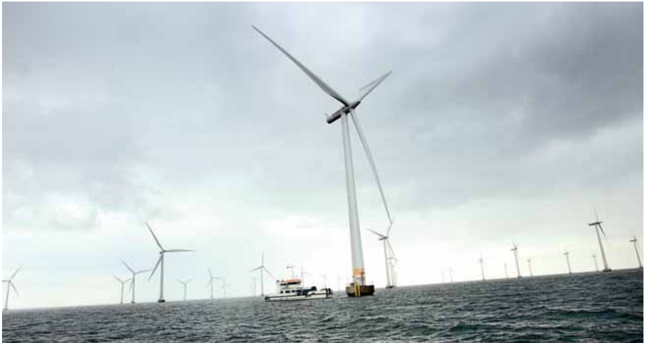
I fremtiden vil mængden af vindenergi i Danmark øges markant. Naturgassen kan potentielt spille en meget væsentlig rolle som reguleringsbrændsel i et energisystem, hvor en høj andel af strømmen kommer fra en uforudsigelig kilde som vind.

dighederne kullene i elproduktionen i nogle år, for omkring år 2030 at gå over til gasfyring, der som nu fungerer som en helt nødvendig og miljøvenlig reservekraft for vindproduktionen i Nordsøen, som gennemsnitligt leverer ca. 80 pct. af det danske elforbrug.