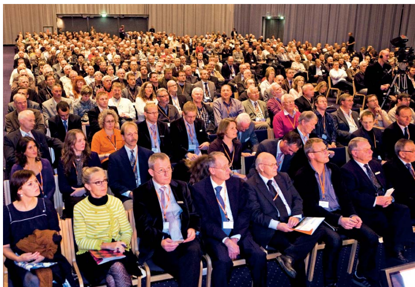
Det er efterhånden en tradition, at der sættes deltagerrekord ved hvert landsmøde. Det var også tilfældet i år, hvor hele 1.636 var troppet op til to dage i Bella Center i København med fagligt program og socialt samvær med kollegaer fra hele landet.