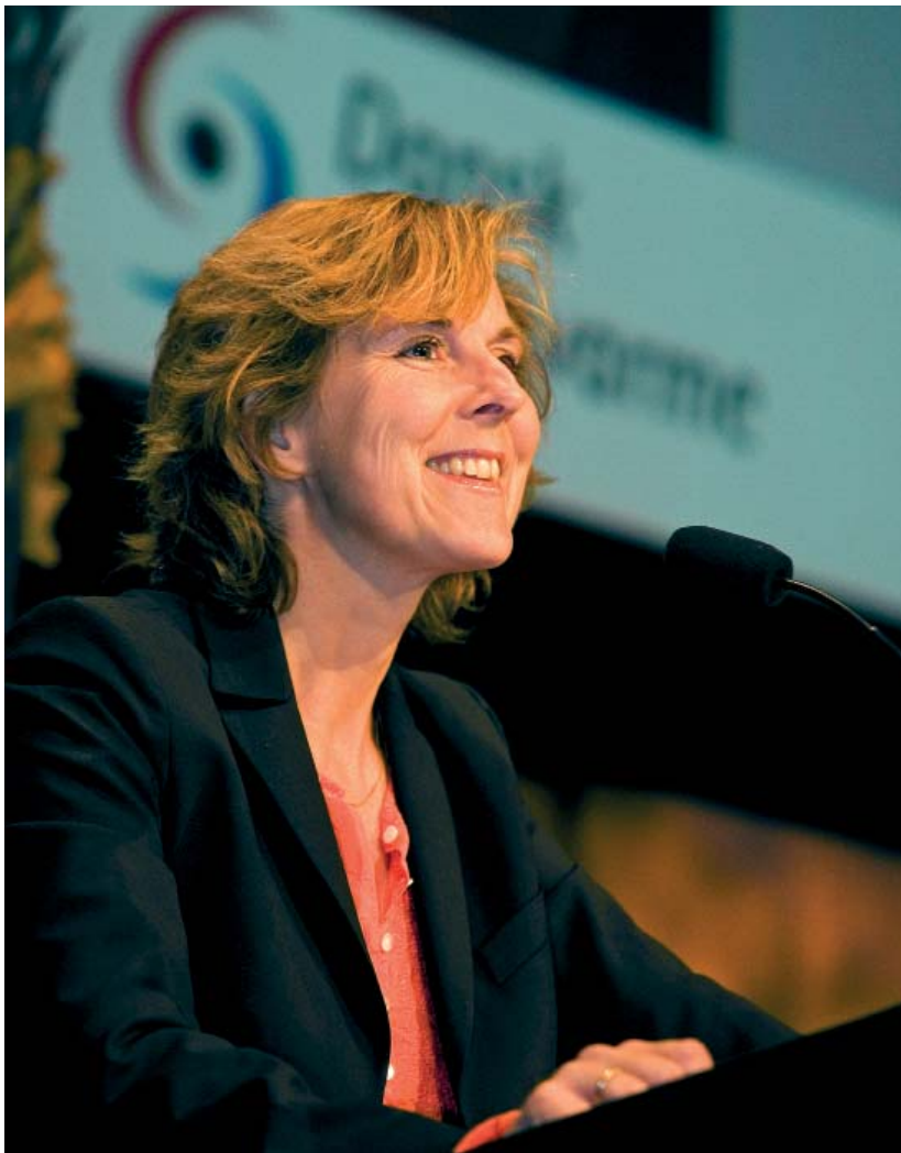
Fjernvarmen har været en afgørende forudsætning for de resultater, der er skabt, konstaterede en veloplagt klima- og energiminister, Connie Hedegaard, da hun talte ved Dansk Fjernvarmes landsmøde.

Blandt de mange stande og træfpunkter lyste den fælles stand fra FIF Marketing og Dansk Fjernvarme op med den let genkendelige orange