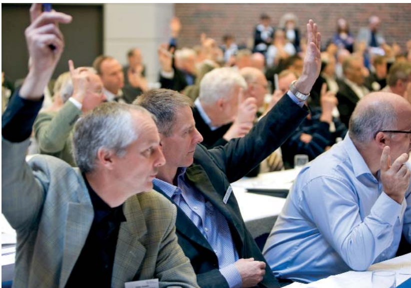
Omkring 130 var mødt frem til årets generalforsamling. Dansk Fjernvarmes generalforsamling er foreningens øverste myndighed og her kan medlemmerne komme i dialog og gøre deres indflydelse gældende.