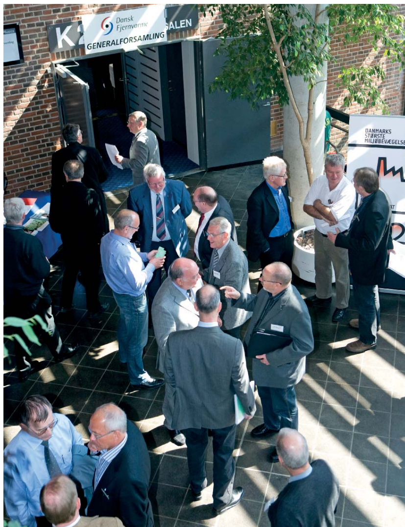
H. C. Andersen Hotel i Odense lagde traditionen tro lokaler til Dansk Fjernvarmes generalforsamling.